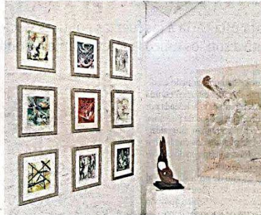
La muestra recorre diferentes expresiones artísticas.